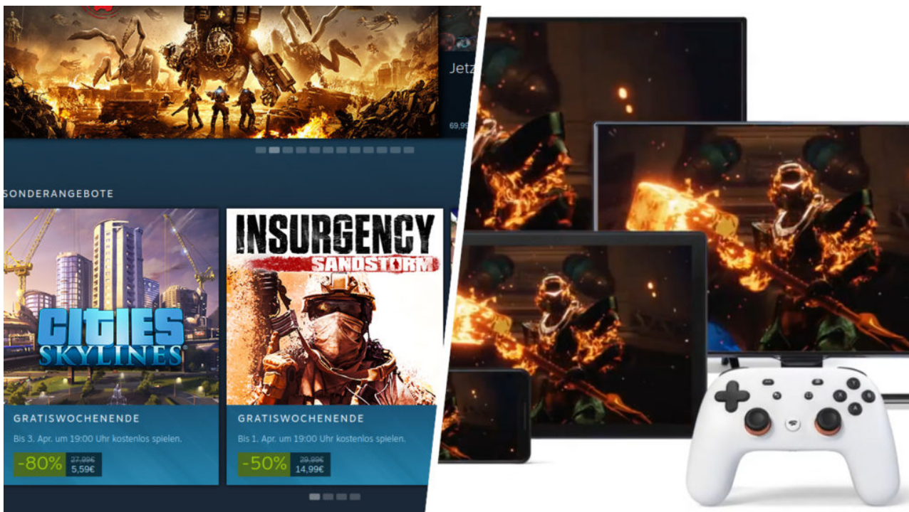
Steam und Stadia: Der Platzhirsch von Valve gegen Googles Neuanwärter

Unabhängig von der Form, ist mehr als ein Drittel aller Spieler überzeugt, dass eine Spielanleitung Teil des Produkts ist und sind nicht bereit, mehr dafür zu bezahlen. 40 Prozent finden es hingegen in Ordnung, einen Aufpreis zu zahlen, der die Produktionskosten abdeckt. Solange Bestandteile eines Spiels aber nicht modular gekauft werden können, ist der Unterschied als Konsument aber nicht zu erkennen. Das übrige Viertel ist gewillt, sich eine limitierte Ausgabe des Spiels zu kaufen, wenn ein Handbuch mitgeliefert ist.