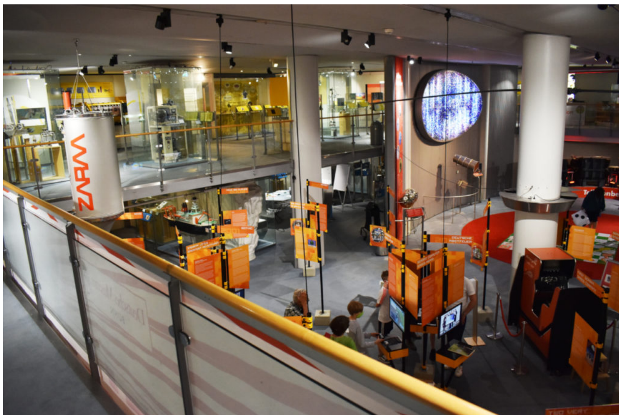
Die Sonderausstellung befindet sich im Untergeschoss des Museums.

Deutlich besser funktionieren in diesem Kontext Moorhuhn und die Spiele des Poly-Play , die kurzweilige Unterhaltung bieten können und sowohl für alte Hasen und Neueinsteiger funktionieren. Der Power-Slide -Automat ist mit seiner Neigetechnik das Highlight der Ausstellung. Die übrigen, nicht spielbaren, Exponate sind im Vergleich dazu allenfalls Beiwerk. Dennoch runden sie das Gesamtbild ab und stillen den Wissensdurst derjenigen, die einen kleinen Einblick die Geschichte der deutschen Entwickler-Landschaft werfen wollen.